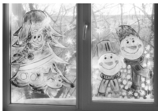
► Столовая сталелитейного цеха