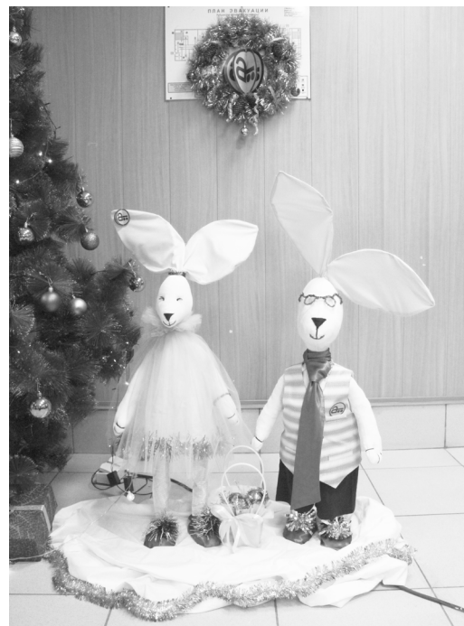
► Отдел по работе с персоналом