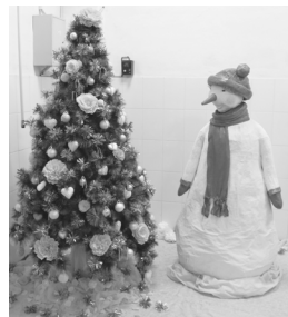
► Модельный цех