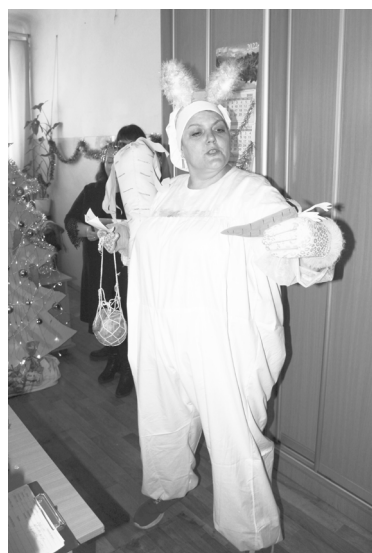
► Цех механической обработки