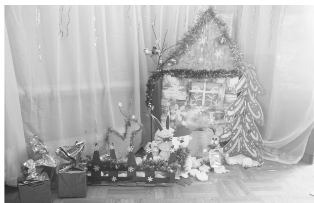
► Железнодорожный участок