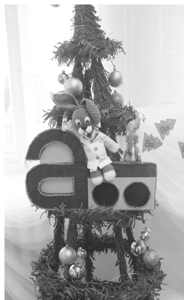
► Химическая лаборатория