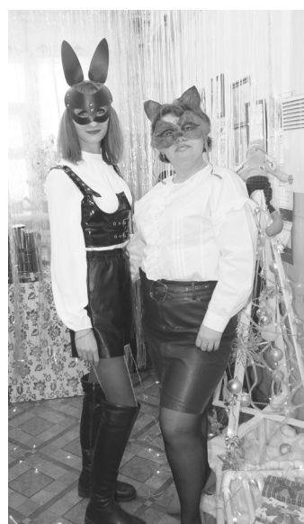
► Ремонтно-инструментальный цех