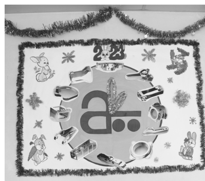
► Финансово-экономический отдел