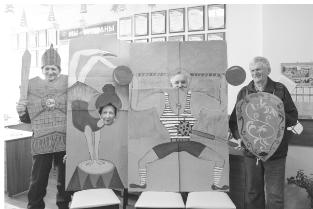
► Совет ветеранов

Вашему вниманию представлен небольшой фотоотчет по конкурсу.