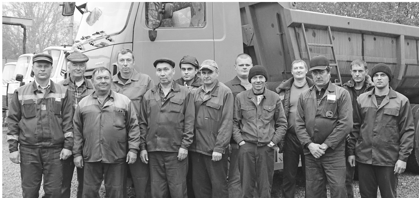
► Бригада водителей участка вывоза технологических отходов.

В нашей стране День автомобилиста отмечается с 1980 года в последнее воскресенье октября.