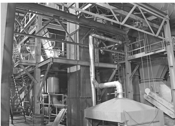
► Установлена новая дополнительная башня охлаждения возвратной формовочной смеси.

По материалам официального сайта АО «Алтайвагон» http://altaivagon.ru/