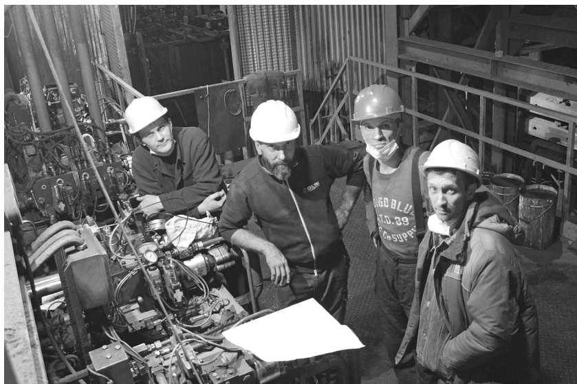
► Специалисты итальянской компании Kuttner Savelli вместе со специалистами Рубцовского филиала АО «Алтайвагон» за наладкой гидравлического оборудования автоматической формовочной линии крупного литья.

После модернизации проектная производительность АФЛ увеличится с 750 до 1200 вагонокомплектов в месяц.