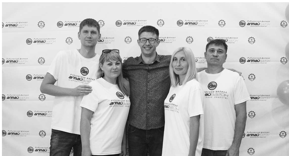
► В заводская научно-практическая конференция рационализаторов.

Идеи рационализаторов являются важным ресурсом для совершенствования производственных процессов в Рубцовском филиале АО «Алтайвагон», большинство предложенных инноваций активно внедряются и приносят ощутимый экономический эффект. Рационализатором быть почетно, ведь рабочий потенциал сотрудника, умеющего мыслить нестандартно, будет высоко цениться при любых экономических условиях.