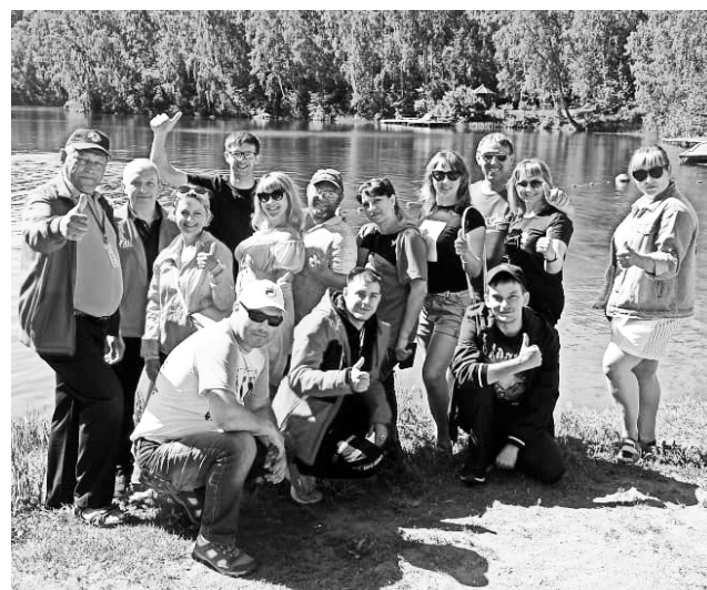
► Профсоюзный актив Рубцовского филиала АО «Алтайвагон» на берегу озера Ая.

Одна из представленных тем семинара: «Подготовка и проведение отчетов и выборов в организациях профсоюза. Де-