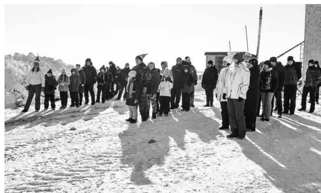
► Для участия в спортивной эстафете сотрудники предприятия разделились на три команды

Зимний баскетбол, эстафета с мячом, забеги в обручах, хоккей на снегу, перетягивание каната, конкурс снеговиков, катание с ледяной горки и прыжки со скакалкой – такова была программа праздника «День снега», организованного профсоюзом предприятия для сотрудников Рубцовского филиала АО «Алтайвагон». День зимних видов спорта и традиционных снежных забав состоялся в этом году впервые и стал приятной новинкой для заводчан.