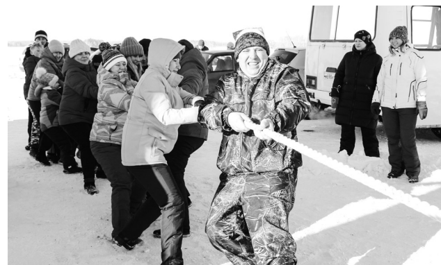
► Финальное испытание эстафеты – перетягивание каната стало, пожалуй, самым зрелищным...