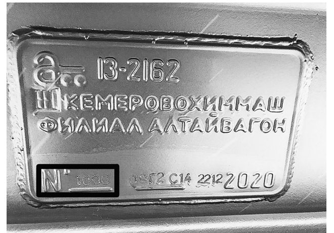
► В январе 2021 года была выпущена тысячная вагон-платформа модели 13-2162

КемеровоХиммаш – филиал АО «Алтайвагон» является одним из крупнейших предприятий химического машиностроения за Уралом и специализируется на производстве оборудования для газовой, металлургической, коксохимической, энергетической, угольной, химической и нефтяной промышленности. В 2021 году завод продолжил освоение новых производственных рубежей.