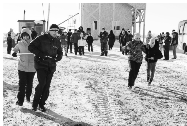
► В состязаниях принимали участие и взрослые, и дети