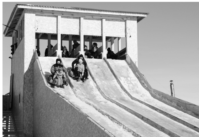
► Зарядиться энергией и хорошим настроением можно было на высокой ледяной горке