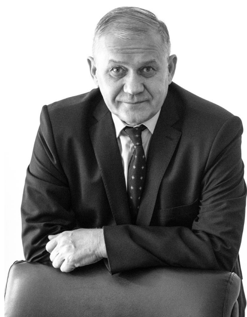
Уважаемые сотрудники и ветераны Рубцовского филиала АО «Алтайвагон»! Поздравляю Вас с Днём машиностроителя!

Машиностроение – одна из наиболее развитых, высокотехнологичных отраслей экономики нашего региона и всей России. Сегодня именно по машиностроительной отрасли судят об экономическом развитии региона, его интеллектуальном и кадровом потенциале. Для нашего города день работников машиностроения – особый праздник, поскольку Рубцовск был и остаётся городом машиностроителей, известным по всей России.