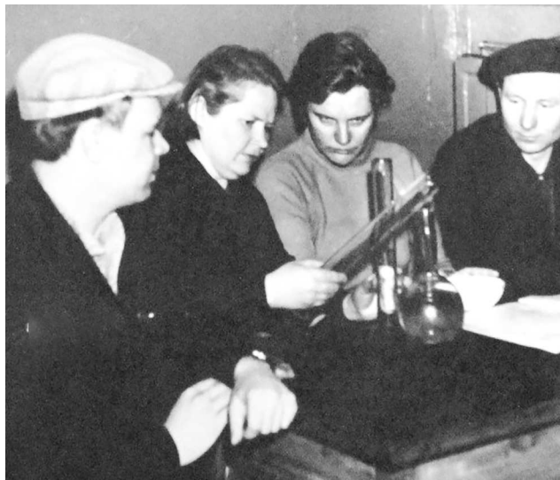
► Лучший коллектив литейщиков-рационализаторов за обсуждением нового эксперимента, 1960-е годы

Публикуем архивные материалы, не вошедшие в основную экспозицию корпоративного музея предприятия, о том, как создавались производственные цеха и отделы Рубцовского завода тракторных запасных частей.