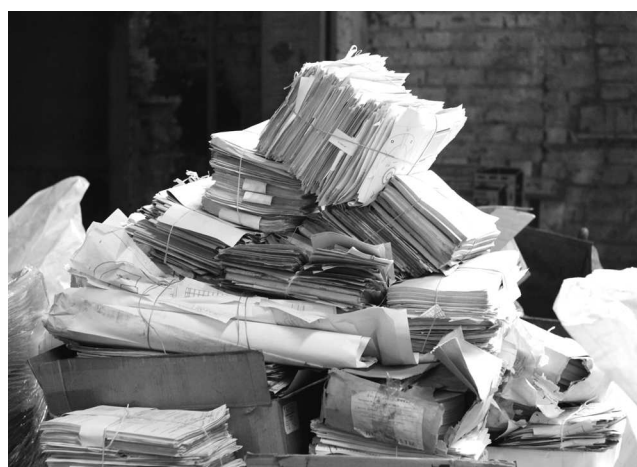
► По итогам экомарафона 2019 года было собрано 860 килограммов макулатуры

В начале апреля в Рубцовском филиале АО «Алтайвагон» дан старт очередному марафону по сбору макулатуры среди сотрудников предприятия. Акция, организованная Молодёжным Советом, помимо экологической, имеет ещё и благотворительную цель — средства, вырученные от сдачи макулатуры на переработку, заводская молодёжь планирует потратить на приобретение подарков детям сотрудников с ограниченными возможностями здоровья.