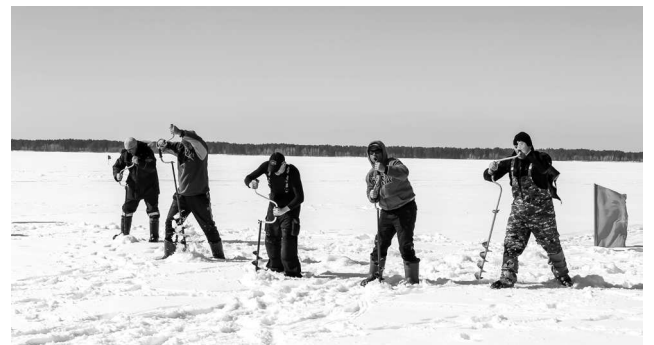
► ... рыбаки соревновались в скоростном бурении лунок