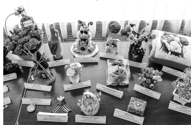
▶ На конкурс было представлено 90 работ

Выбирать победителей было действительно трудно, поэтому жюри конкурса