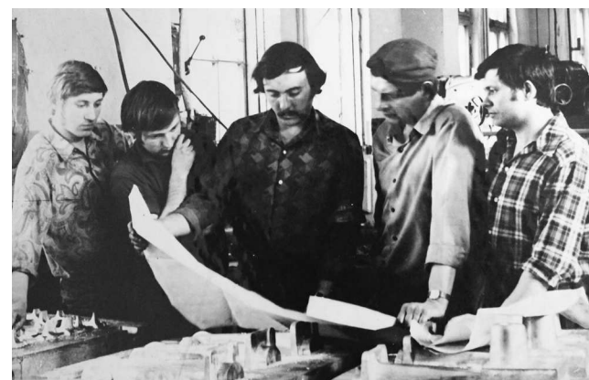
► Комсомольско-молодёжная бригада Модельного цеха, 1970-е годы

Продолжение читайте в следующих номерах газеты.