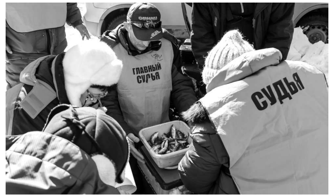
► Пока судьи тщательно взвешивали весь улов...