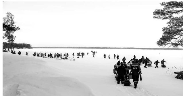
► По сигналу главного судьи рыбаки выдвинулись на лёд