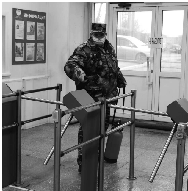
► Проходная завода также обрабатывается дезинфицирующими средствами

Рубцовский филиал АО «Алтайвагон» неукоснительно соблюдает рекомендации Правительства Российской Федерации и региональных органов власти по профилактическим и другим мерам, направленным на противодействие распространению новой коронавирусной инфекции. В целях снижения угрозы здоровью заводчан Рубцовский филиал АО «Алтайвагон» разработал комплекс защитных мер и оперативно его реализует.