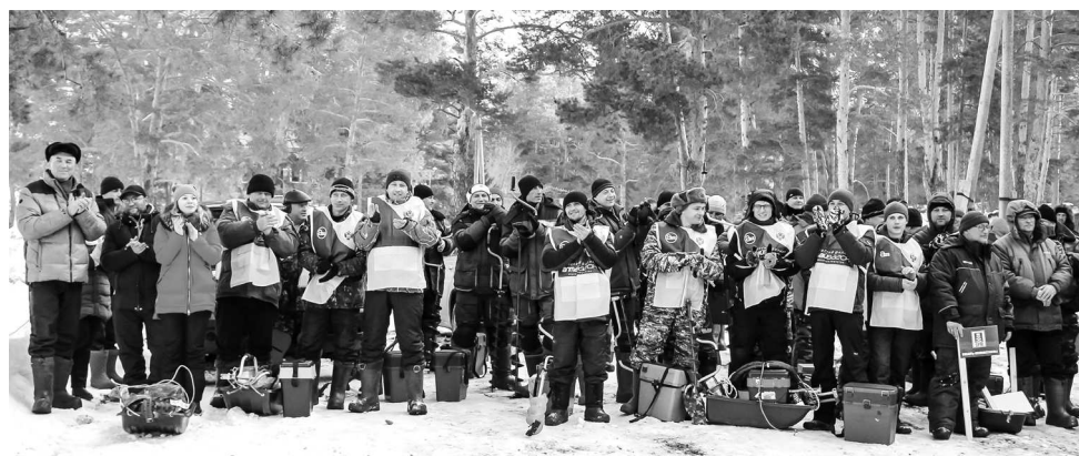
► Команда Рубцовского филиала «Алтайвагон» традиционно была самой многочисленной