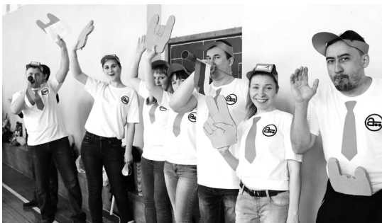
► И болельщики тоже!