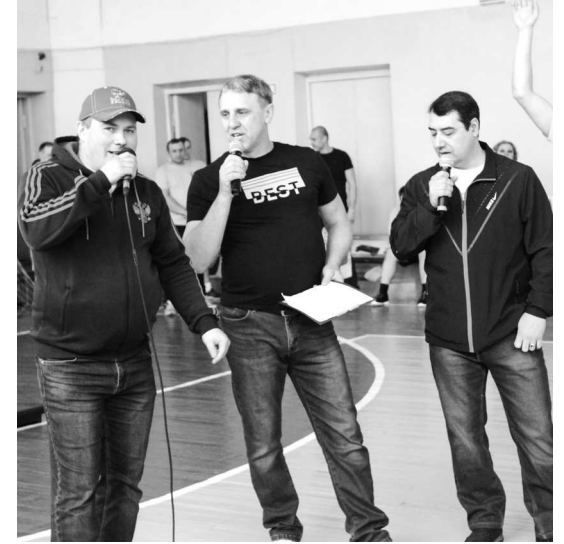
► Команда Сталелитейного цеха «СоЛнЦе» удивила не только спортивными успехами, но и песней собственного сочинения