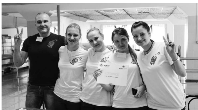
► Новичок сезона 2020 — команда «Динамит» (сборная Литейного цеха №1) оправдала свое название, одержав победу не только в отборочном туре, но и в супер-игре

В середине февраля Молодёжный Совет Рубцовского филиала АО «Алтайвагон» открыл очередной сезон интеллектуально-развлекательных игр «100/1». В отборочном туре приняли участие 8 команд — представители заводоуправления, Сталелитейного цеха, отдела автоматизированной системы управления технологическим процессом, Литейного цеха №1, отдела технического контроля, Совета ветеранов, Ремонтно-инструментального цеха и отдела материально-технического снабжения и сбыта. В ожидании финальной игры и определения победителя сезона заглянем за кулисы мероприятия и узнаем, как создается заводская игра «100/1».