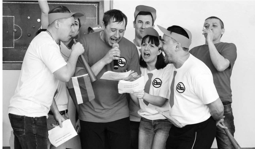
► Артистизм и сплочённость принесли победу команде болельщиков «Форсаж»