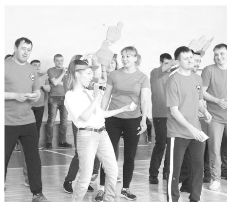
Крупным планом >> стр.4

В середине февраля Молодёжный Совет Рубцовского филиала АО «Алтайвагон» провёл отборочный тур интеллектуально-развлекательной игры «100/1».