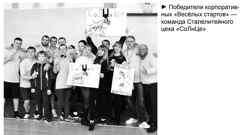
► Победители корпоративных «Весёлых стартов» — команда Сталелитейного цеха «СоЛнЦе»