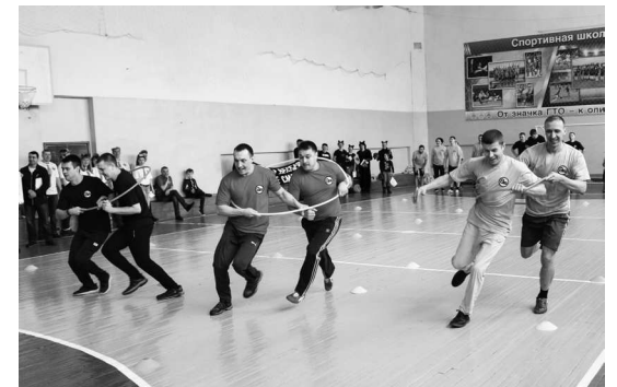
► Эстафета в обручах была одной из самых сложных