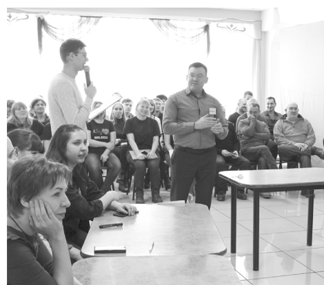
#Молодёжь >> стр.3

В Рубцовском филиале АО «Алтайвагон» состоялся первый этап Спартакиады трудовых коллективов предприятия.