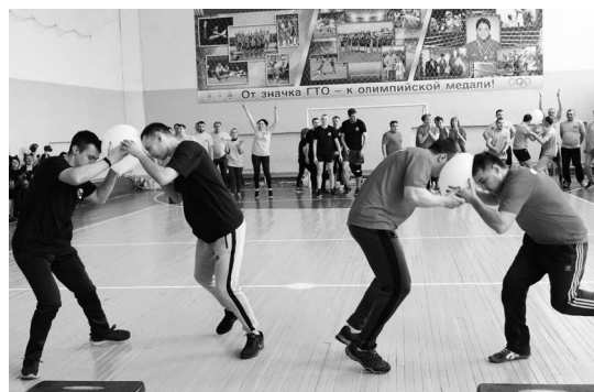
► Иногда спортсменам требовалось напрячь голову