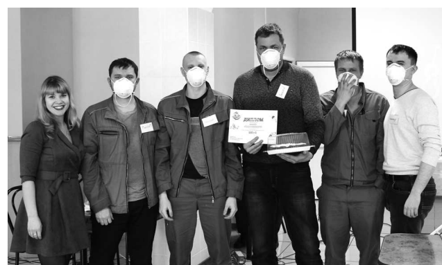
► А вот пугающее название «Коронавирус» победу сборной ОАСУТП в этом сезоне не принесло...