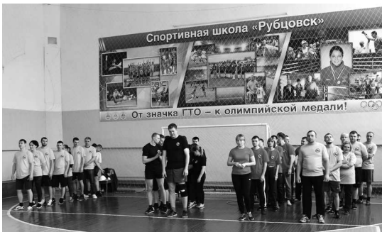
► Команды к старту готовы!

Команды болельщиков поддерживали спортсменов остроумными «кричалками» и яркими плакатами, а также представили визитки своих команд, заслужив высокие оценки жюри и специальные призы от Профсоюзного комитета Рубцовского филиала АО «Алтайвагон». А отличная физическая подготовка и лучший результат в сложных парных эстафетах определили победителей спортивной части состязания — победу в «Весёлых стартах» одержала команда «СоЛнЦе», на втором месте оказалась команда «Форсаж», третий результат показала команда «Динамит», четвёртое место досталось команде «Чёрная пантера».