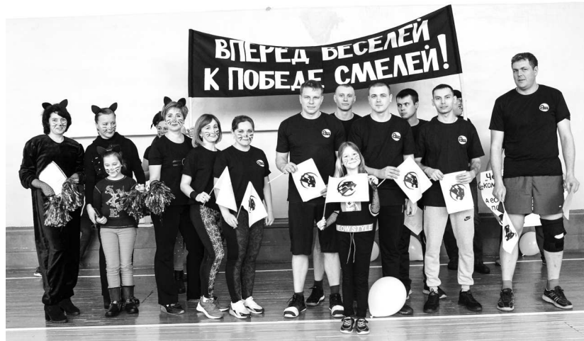
► Команда болельщиков «Чёрная пантера» была, пожалуй, самой стильной