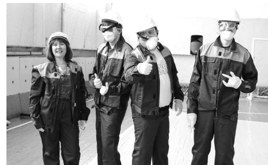
► Быстро и правильно облачить в комплект спецодежды одного из участников получилось не у всех