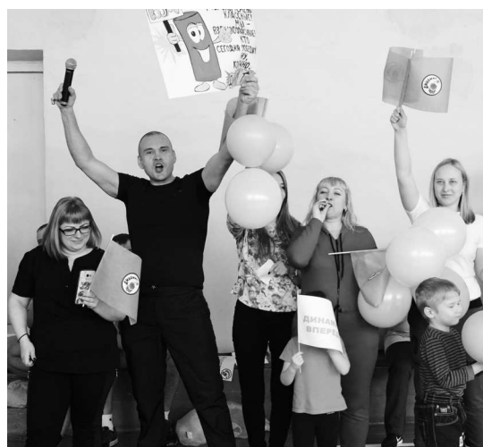
► Команда болельщиков «Динамит» малочисленность состава компенсировала экспрессией