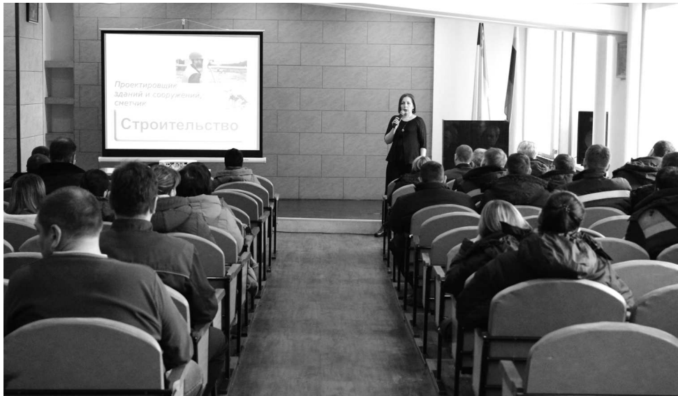
► За два дня встречи с представителями ВУЗов города Рубцовска посетили около 200 заводчан

4 и 5 марта в Рубцовском филиале АО «Алтайвагон» состоялись встречи представителей высших учебных заведений Рубцовска с сотрудниками завода. Консультации по вопросам получения высшего образования и профессиональной переподготовки провели специалисты приёмных комиссий Рубцовского индустриального института и Алтайского государственного университета. Встречи были организованы Молодёжным Советом совместно с кадровой службой предприятия в рамках работы по повышению квалификации и профессионального обучения персонала.