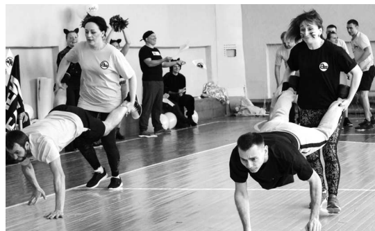
► Победа порой добывалась нелегко...