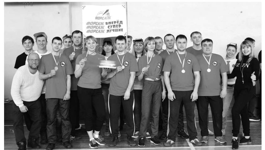
► Обладатели второго места в спортивной эстафете — команда «Форсаж»