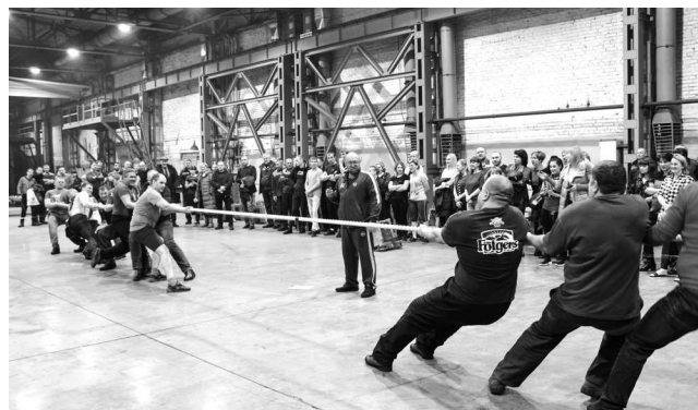
► Открывали Спартакиаду соревнования по перетягиванию каната, которые оказались самыми зрелищными

В конце февраля в Рубцовском филиале АО «Алтайвагон» состоялся первый этап самого масштабного заводского спортивного события — Спартакиады трудовых коллективов предприятия. Привычная программа Спартакиады в 2020 году была серьёзно пересмотрена — в список спортивных дисциплин оргкомитет соревнований включил плавание, состязания спортивных семей, летнюю полосу препятствий и весёлые старты.