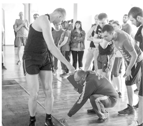
Корпоративный спорт >> стр.2

Подготовлено по материалам http://altaiwaggon.ru ;