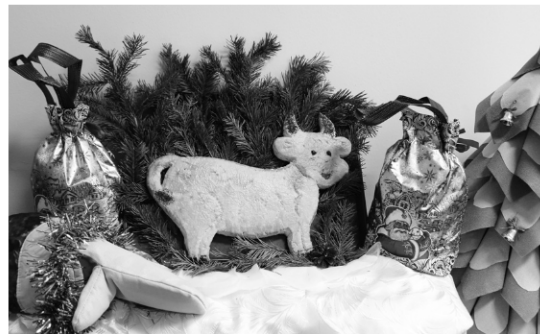
► Коллектив столовой презентовал жюри конкурса съедобный символ наступающего года