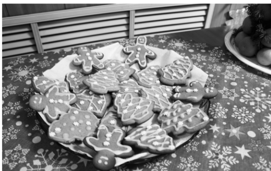
►...и традиционное новогоднее угощение – имбирные пряники, расписанные глазурью