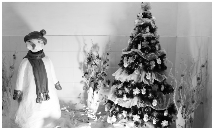
► Коллектив Модельного цеха воссоздал атмосферу сказочного зимнего леса