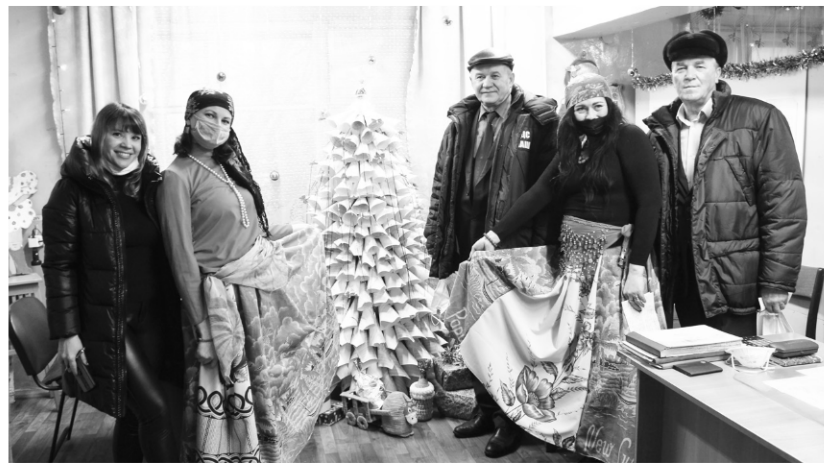
► В отделе технического контроля Литейного цеха №1 счастье и удачу в новом году жюри предсказали цыганки