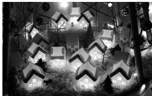
► Уютная заснеженная деревенька разместилась у подножия елки в ПДБ Литейного цеха №1