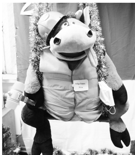
► ... а благодаря стараниям мастериц из 10 склада бычок не только обрел имя «Леха», но и освоил профессию обрубщика