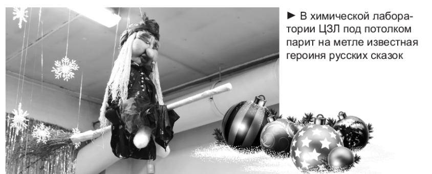
► В химической лаборатории ЦЗЛ под потолком парит на метле известная героиня русских сказок