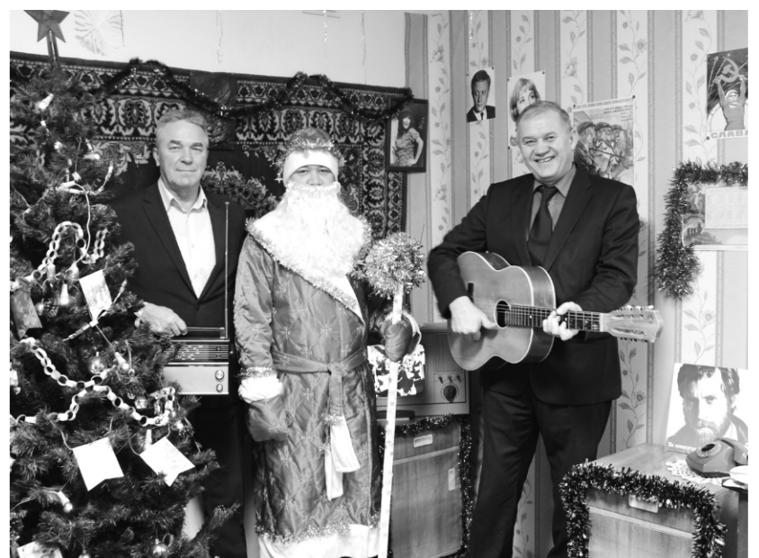
► В отделе информационных технологий жюри конкурса ждал уют советской квартиры с елкой, гитарой и «Новогодним огоньком» по телевизору