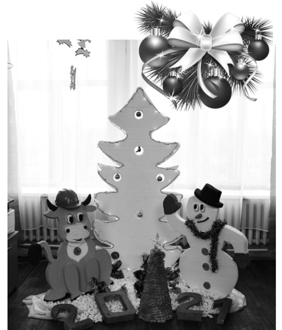
► В помещении входного контроля ОТК жюри встретили бычок и снеговик