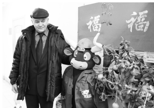
► В отделе главного металлурга бык встретил гостей поздравлениями на китайском языке...