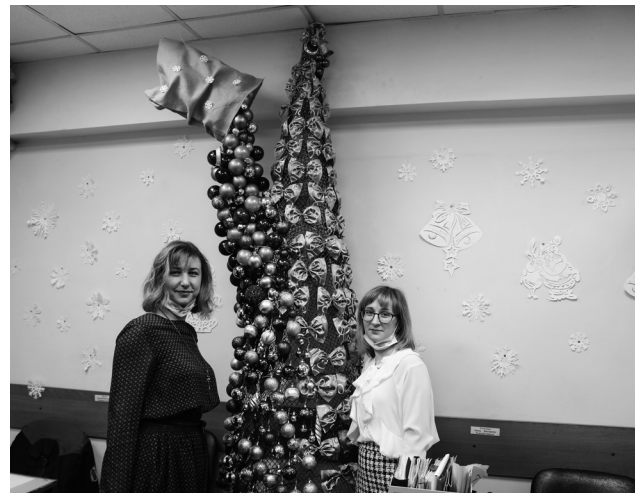
► Изысканная елка появилась в отделе главного металлурга