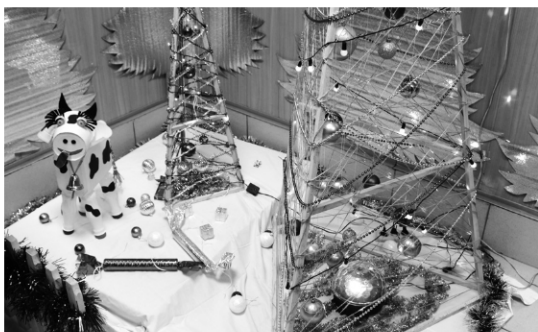
► Отдел по работе с персоналом подготовил праздничную композицию с ажурными елочками...

Определить победителей оказалось непросто, поэтому сразу несколько трудовых коллективов – отдел информационных технологий, Модельный цех, отдел главного металлурга и склад сбыта – были отмечены как лучшие в различных номинациях. На втором месте оказались коллективы отдела кадров, 10 склада, лаборатории неразрушающего контроля и Ремонтно-инструментального цеха, на третьем месте – химическая лаборатория ЦЗЛ, приемная, отдел технического контроля (Литейный цех №1), коллектив ПДБ Литейного цеха №1 и 6 склад Сталелитейного цеха. Однако, по традиции, ценные подарки получают все трудовые коллективы, принявшие участие в конкурсе, ведь главную задачу – создать новогоднее настроение самим себе и коллегам и настроиться на позитивный лад выполнили все участники без исключения!