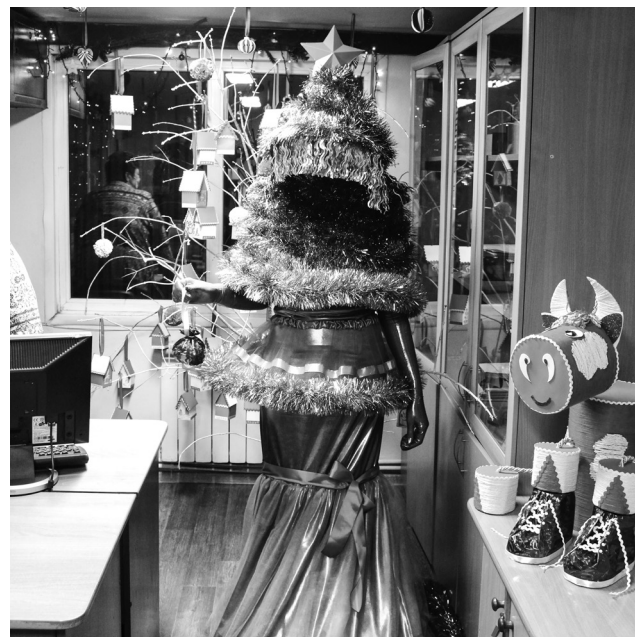
► На конкурс были представлены несколько «живых» новогодних красавиц. Одна из них – елка коллектива склада сбыта

Празднично украшенная елка – главный символ Нового года. Лучше всего, конечно, не рубить живую ель ради нескольких дней праздника и не покупать искусственную, а создать свое собственное, уникальное новогоднее дерево из подручных материалов! Именно так поступили сотрудники Рубцовского филиала АО «Алтайвагон» – участники конкурса на самую креативную елку.