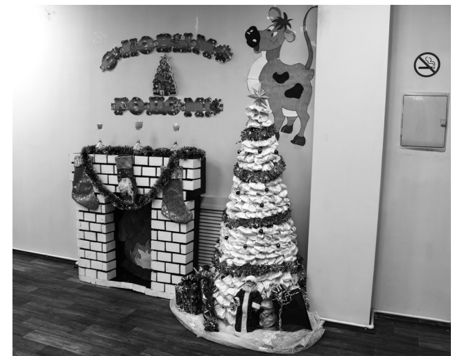
► Сотрудники 6 склада создали «антикоронавирусную» елку из защитных тканевых масок

Оригинальность замысла, неординарность и уникальность созданных работ были, без сомнения, по достоинству оценены жюри конкурса. Впереди – новые творческие конкурсы, а значит, новая возможность для заводчан «раскрыться» и проявить себя с неожиданной стороны!