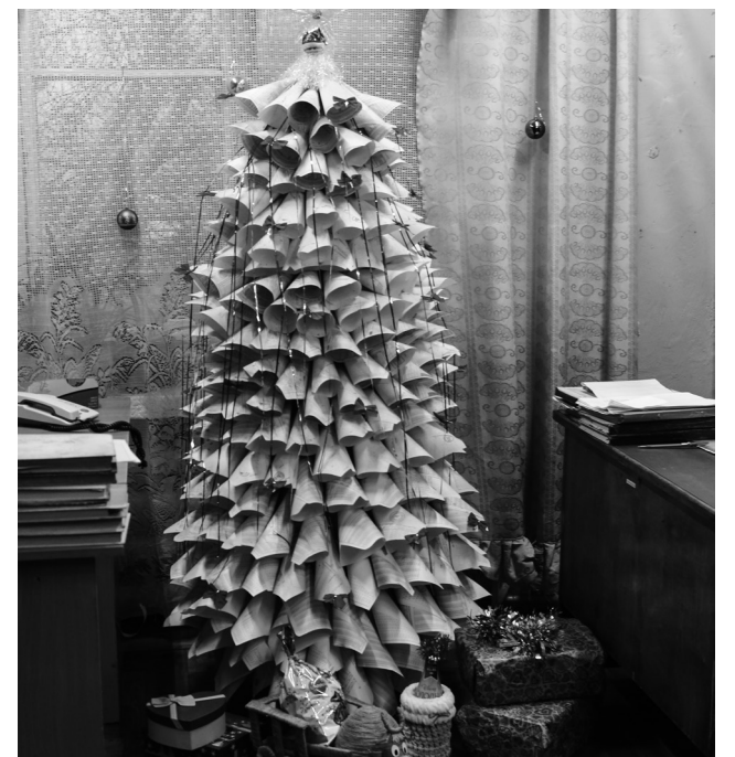
► Экологичная пушистая елка из черновики и «оборотки» установлена в ОТК Литейного цеха №1