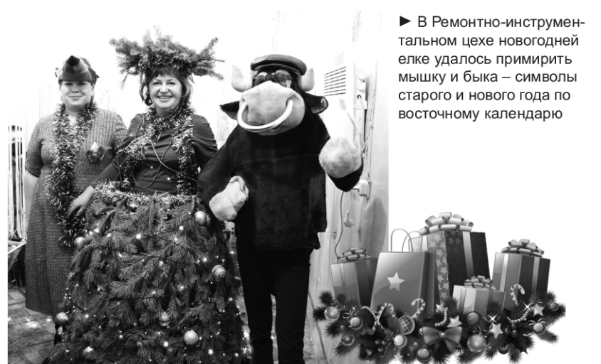
► В Ремонтно-инструментальном цехе новогодней елке удалось примирить мышку и быка – символы старого и нового года по восточному календарю