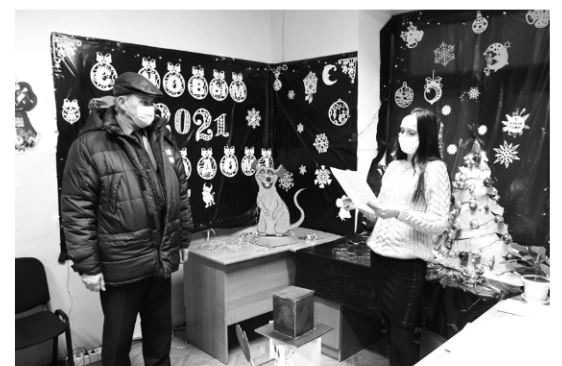
► Сотрудники отдела главного метролога создали и презентовали настоящий новогодний музей