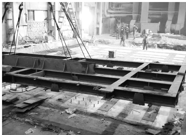
► Процесс увеличения длины линии заливки на АФЛ

В 2019 году Рубцовский филиал АО «Алтайвагон» вышел на рекордный для себя объем производства в 65 643 тонны стального литья в год. Работа на пределе производственных мощностей, отвечающая потребностям вагоностроительного рынка, выявила необходимость модернизации действующего оборудования – прежде всего, автоматической формовочной линии крупного литья.