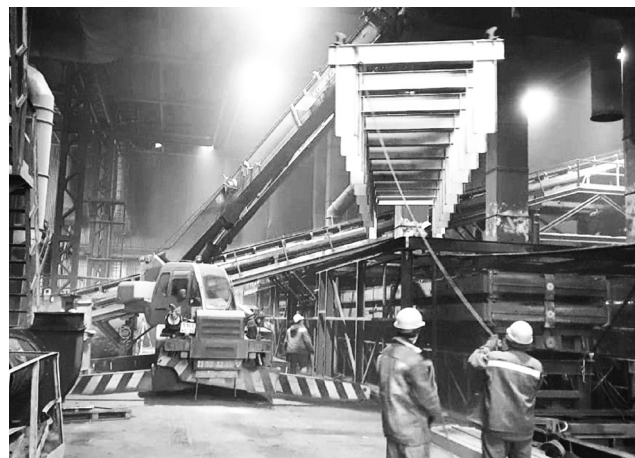
► Процесс расширения линии охлаждения

Техническое перевооружение линии не только увеличит ее производительность, но и повысит качество отливок за счет снижения температуры формовочной смеси и снижения температуры отливок до выбивки. Стоимость модернизации АФЛ крупного литья составляет 583,6 миллионов рублей.