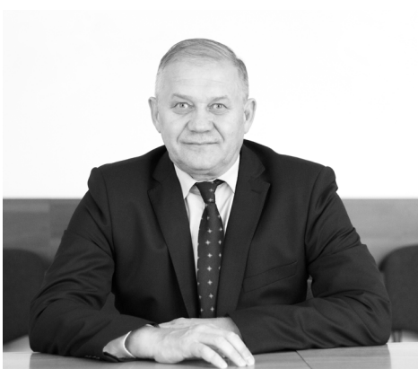
РАБОТА НА ОКРУГЕ

Материалы подготовлены пресс-службой АО «Алтайвагон»