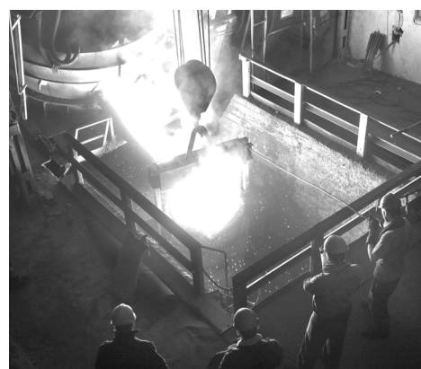
Слово Совету ветеранов

В январе специалистами Рубцовского филиала АО «Алтайвагон» выполнены работы по постановке на производство в Модельном цехе деталей мелкого литья