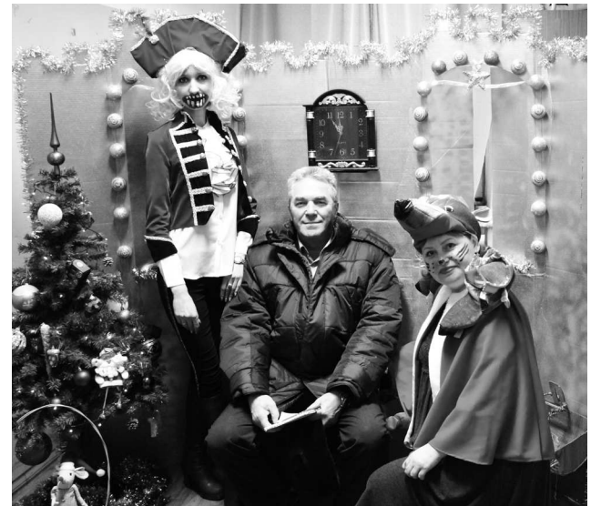
► Ремонтно-инструментальный цех подготовил сценку по мотивам повести-сказки Эрнста Гофмана «Щелкунчик и Мышиный король»