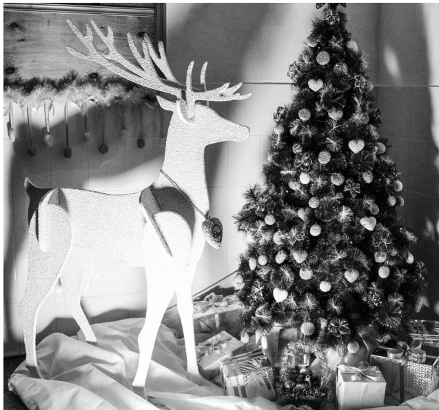
► Сотрудники Модельного цеха создали благородную и изысканную новогоднюю композицию

Вот и настала пора конкурса на лучшее новогоднее украшение кабинета — самого любимого и популярного у заводчан. Участие в конкурсе приняли 27 трудовых коллективов Рубцовского филиала АО «Алтайвагон», а творческие работы конкурсантов поражают оригинальностью задумки, масштабностью и мастерством исполнения. Кроме того, в этом году участники конкурса удивляли жюри театрализованными представлениями и обилием праздничной иллюминации.