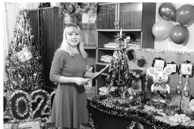
► Добрые новогодние пожелания в стихах ждали жюри в Скрапоразделочном участке