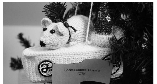
► Судя по количеству представленных на конкурс мышек — символов накопления и богатства, 2020 год будет изобильным

Игрушками, созданными сотрудниками Рубцовского филиала АО «Алтайвагон», уже украшены две елки — в заводоуправлении и на проходной предприятия, так что оценить творчество коллег может любой желающий. Все участники конкурса будут награждены ценными призами.