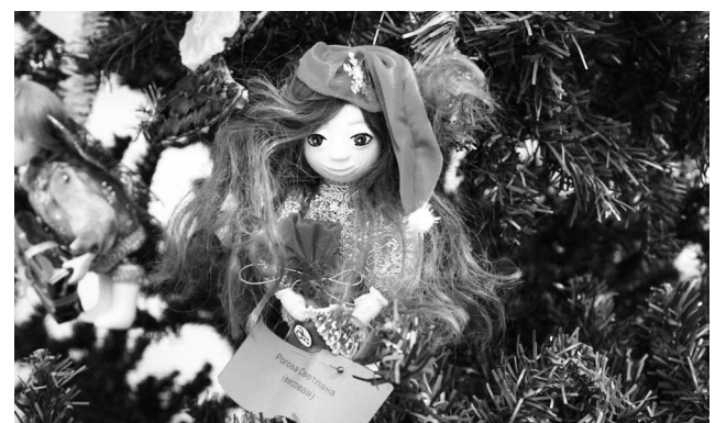
► Сказочная фея с подарками, изготовленная Светланой Роговой (весовая), слегка «разбавляет» мышиную тематику