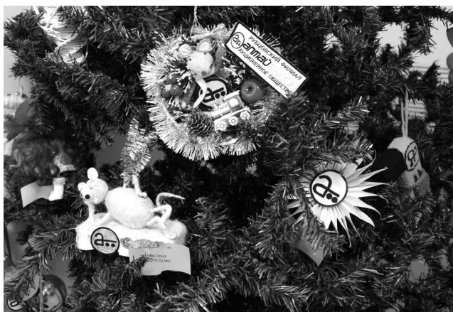
► В 2019 году участникам конкурса было предложено изготовить елочную игрушку с логотипом предприятия

Предпраздничные творческие конкурсы стали для сотрудников Рубцовского филиала АО «Алтайвагон» традиционным и приятным напоминанием о приближающейся знаменательной дате или событии. В этом году творческий конкурс на создание елочной игрушки с логотипом нашего