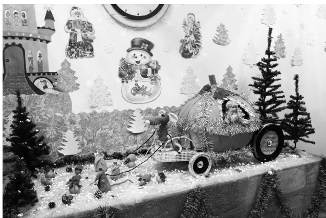
► В Лаборатории неразрушающего контроля гостей встречает сказочная карета Золушки, запряженная «тройкой» мышей