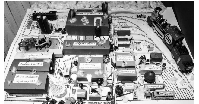
► Коллектив 10 склада создал настоящую 3D-модель завода

выполненные сотрудниками Модельного цеха и отдела Главного металлурга, на втором месте — оформление кабинетов, выполненное коллективами Скрапоразделочного участка, склада сбыта, ЛНК и химической лаборатории ЦЗЛ, на третьем — декор от отдела по работе с персоналом, коллектива 10 склада, ОИТ, Литейного цеха №1 и 6 склада. Кроме того, в номинации «Театрализованное представление» лучшим стал коллектив Ремонтно-инструментального цеха, на втором месте — коллектив ОТК (Литейный цех №2), на третьем — коллектив ЛНК (Литейный цех №2). Благодарим участников конкурса за новогоднее настроение и желаем творческих идей в наступающем новом году!