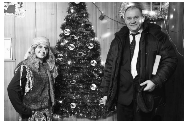
► В Литейном цехе №2 жюри конкурса с удовольствием сфотографировались со сказочной Бабой Ягой