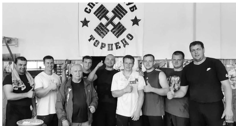
► Настоящие заводские богатыри — поклонники гиревого спорта

В конце августа состоялся очередной, летний этап Спартакиады трудовых коллективов Рубцовского филиала АО «Алтайвагон». В программе соревнований, помимо знакомых и привычных заводчанам легкой атлетики и гиревого спорта, были заявлены пляжный волейбол и уличный баскетбол. Соревнования проходили на двух спортивных площадках — стадионе «Торпедо» и стадионе ДЮСШ «Спарта».