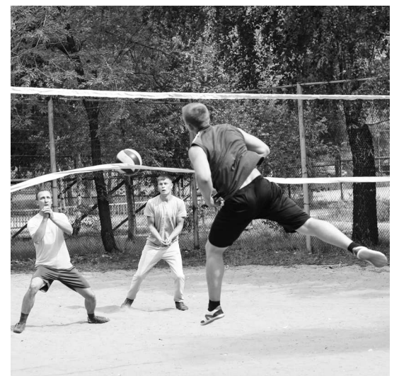
► Возможность побороться за первенство была и у любителей пляжного волейбола

Совсем скоро состоится завершающий этап Спартакиады, в котором с сотрудниками Рубцовского филиала АО «Алтайвагон» в интеллектуальных видах спорта сразятся ветераны завода.