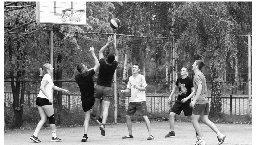
► Соревнования по уличному баскетболу (баскетболу в одно кольцо) были, пожалуй, самыми зрелищными

Однако в командных видах спорта — пляжном волейболе, уличном баскетболе все оказалось не так однозначно. Вероятно, поэтому эти соревнования стали самыми зрелищными. За первенство в динамичном и порой агрессивном уличном баскетболе развернулось настоящее сражение между командой Сталелитейного цеха и