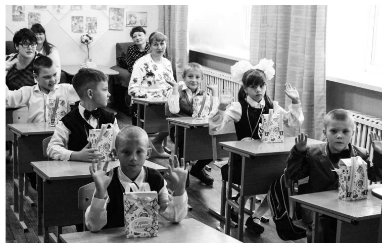
► Первоклассники — воспитанники коррекционной школы-интерната с подарками от молодежи Рубцовского филиала АО «Алтайвагон»

В этом году подарки от Молодежного Совета Рубцовского филиала АО «Алтайвагон» получили более 150 первоклассников! Яркие рюкзаки из цветного картона заводская молодежь изготовила вручную и наполнила полезной и нужной каждому школьнику канцелярией — карандашами, наборами для лепки, ластиками, шариковыми ручками и фломастерами. Подарки одинаково пришлись по душе и первокласскам, и педагогам, и родителям. Новоиспеченные школьники-ученики Гимназии №11 получили подарки на торжественной линейке, а воспитанники Коррекционной школы-интерната — на первом в их жизни настоящем школьном уроке.