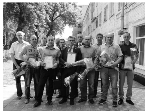
Награды к празднику >> стр.4

В начале июля на живописном берегу реки Алей состоялись очередные городские Военно-спортивные игры. Участие в играх приняла и команда заводчан.