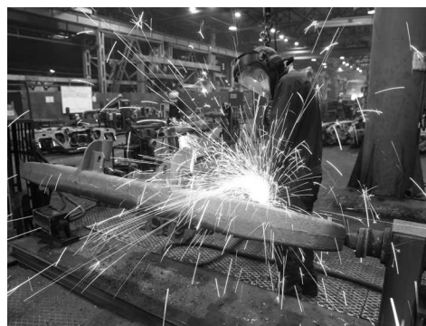
Люди нашего завода >> стр.2, 3

На 4,5% вырос и выпуск литья Рубцовским филиалом «Алтайвагона» и составил за первое полугодие 2019 года 32713,7 тонны. Крупного вагонного литья произведено 18274,35 тонны, мелкого и среднего — 14439,71 тонны. Во втором полугодии 2019 года на АО «Алтайвагон» планируется произвести около 4200 единиц грузового железнодорожного подвижного состава, из них около 1200 единиц — на Кемеровском филиале. В Рубцовском филиале «Алтайвагона» в 2019 году планируется выпустить 65003 тонн стального литья.