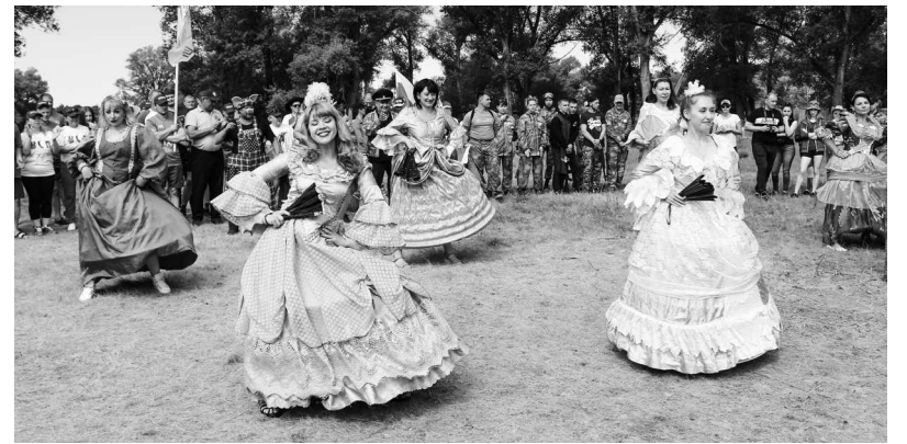
► Темой одного из творческих номеров был выбран год театра в России

ли свои творческие номера беспристрастному и неподкупному жюри, которое по достоинству оценило уровень подготовки и стремление к победе наших заводчан. На церемонии награждения команде Рубцовского филиала АО «Алтайвагон» вручили небывалое количество кубков и наград — за I место в волейболе, нардах, толкании ядра, дартсе, конкурсном обеде, художественной самодеятельности, за II место в футболе, перетягивании каната, отжиманиях, конкурсе приветствий, обустройстве лагеря (бивуака) и рыбной ловле, за III место в метании гра-