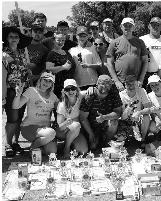
► Команда «Железяка» с урожаем наград

В начале июля на живописном берегу реки Алей состоялись очередные городские Военно-спортивные игры. Несмотря на то, что история Военно-спортивных игр уходит корнями в далёкие 1970-е годы, бывшие комсомольцы с удовольствием продолжают эту традицию и активно привлекают к движению современную молодёжь. Постоянным участником ВСИ является и команда Рубцовского филиала АО «Алтайвагон».