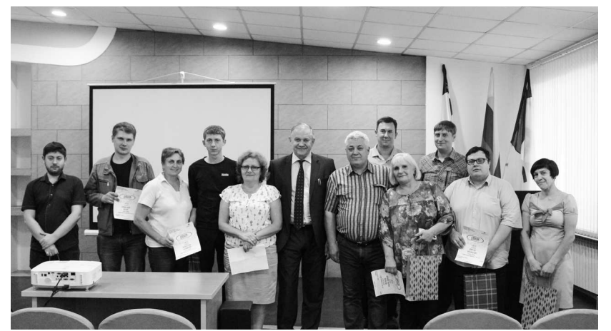
► Все участники конференции награждены дипломами и ценными подарками

28 июня состоялась III научно-практическая конференция рационализаторов в Рубцовском филиале АО «Алтайвагон». По сложившейся традиции, этим мероприятием рационализаторы завода подводят итоги своей работы в 2018-2019 отчетном году.