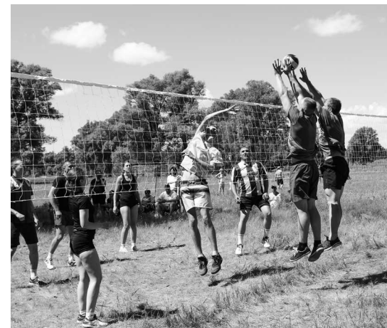
► Сборной Рубцовского филиала АО «Алтайвагон» по волейболу в этом году не было равных. Закономерный результат — I место

маты, гиревом спорте, стрельбе, эстафете, кроссе, ночном ориентировании и оформлении стенгазеты. По совокупности баллов команда «Железяка» заняла II место, лишь самую малость уступив команде «Алмаз», на третьем месте оказались представители войсковой части 6720, на четвертом — сборная «Алтайлес» и «Время». Но вне зависимости от завоеванных наград каждый участник ВСИ-2019 получил в подарок отличное настроение, ощущение праздника и победы, прочувствовал на себе романтику Военно-спортивных игр. Ведь для сторонников здорового образа жизни проигравших просто не бывает!