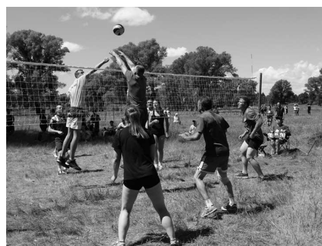
Социальная политика >> стр.3

День металлурга — профессиональный праздник не только сталеваров и заливщиков металла. Всех заводчан — инженеров, обрубщиков, контролёров, мастеров объединяет одно большое общее дело.