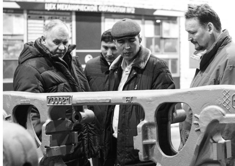
► Представители узбекистанской компании проявили большой интерес к организации производственного процесса и инновационным разработкам рубцовских металлургов

В марте представители АО «Узбекские железные дороги» («Узбекистон темир йуллари») посетили Рубцовский филиал «Алтайвагона» с целью обмена опытом по вопросам производства вагонного литья.