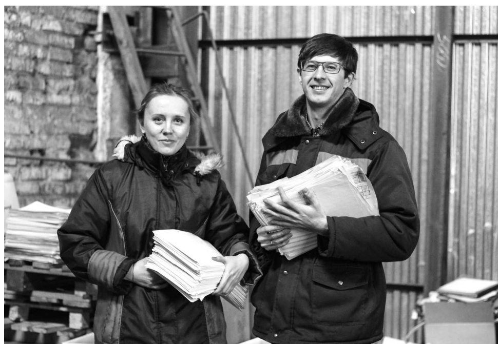
► В разряд вторсырья попали утратившие ценность служебные документы, старые газеты, журналы, рекламные буклеты и картонные коробки

Активисты Молодёжного Совета Рубцовского филиала «Алтайвагона» провели очередную экологическую акцию по сбору макулатуры на предприятии.