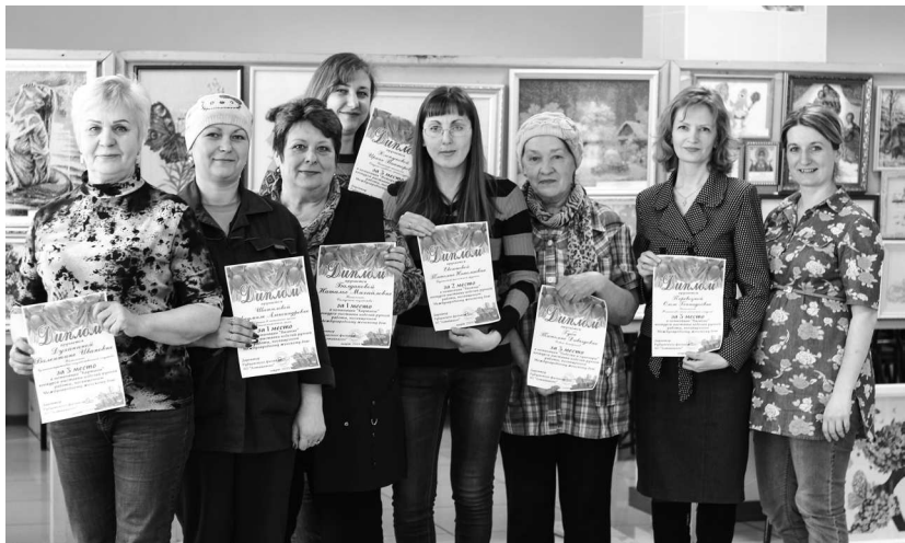
► Каждая участница творческого конкурса «Чудеса рукоделия» получила диплом и ценный подарок

В жизни каждой женщины есть место для творчества. Творите ли вы кулинарные шедевры на собственной кухне, пишете ли картины, создаёте ли из пряжи или ниток, кусочков ткани или бумаги предметы интерьера и сувениры — во всём проявляется сила созидания и уникальная способность женщины наполнять окружающий мир красотой и гармонией.