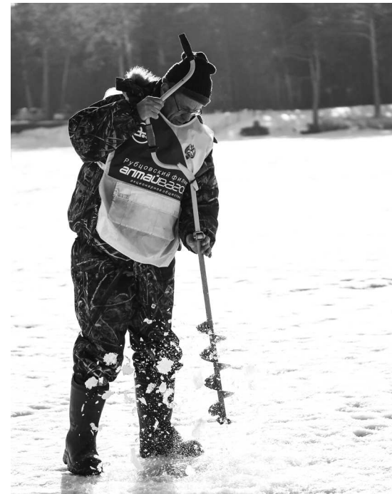
► По сигналу главного судьи острые буры вгрызлись в плотный ледовый панцирь, которым в долгие зимние месяцы сковано озеро. И хотя пробурить лёд метровой толщины — задача не из лёгких, ледяная гладь вскоре запестрела лунками с мутной шугой.