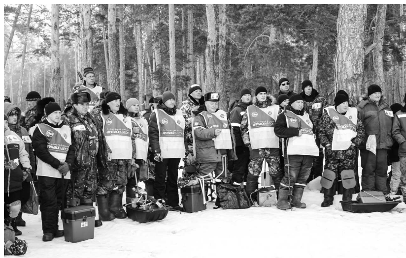
► Команда Рубцовского филиала АО «Алтайвагон» несколько лет подряд является самой массовой — в этом году участие в Чемпионате приняли 68 сотрудников предприятия