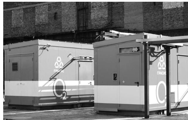
► Новая автоматическая адсорбционная кислородная станция способна производить 200 м 3 кислорода в час

накопительная ёмкость, которая обеспечит постоянное давление кислорода. Необходимое оборудование уже изготавливается на «КемеровоХиммаше». Кроме того, специалистам отдела Главного металлурга и Сталелитейного цеха предстоит отработать все тонкости технологического процесса проведения окислительного периода плавки методом кислородной продувки.