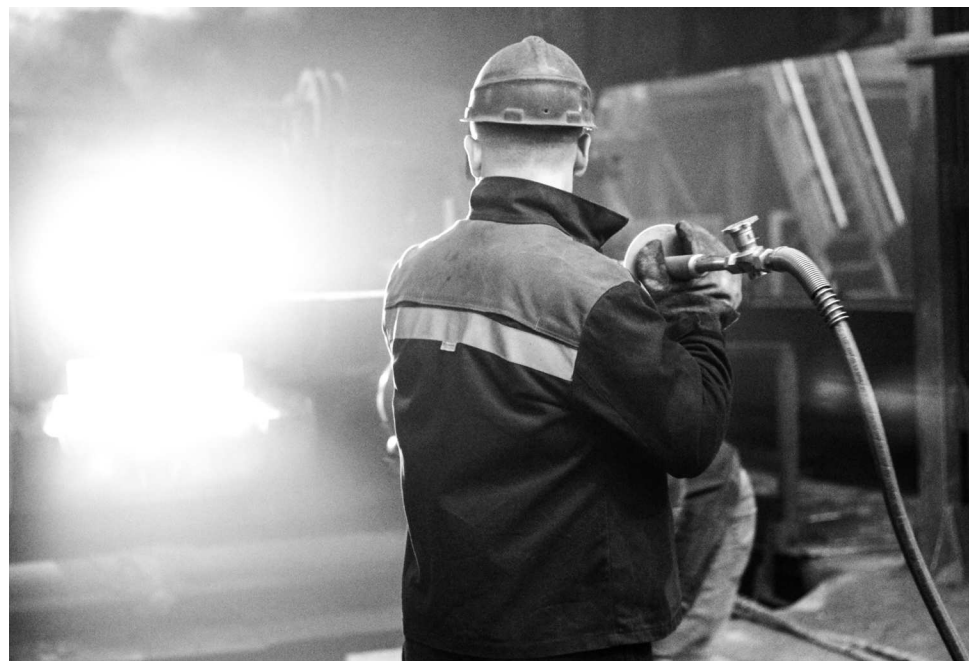
► Продувка через жидкий металл кислорода позволит уменьшить время цикла одной плавки на 20 минут

Сталелитейного цеха и Ремонтно-строительного отдела, а подготовка к внедрению новой технологии заняла больше года. Поскольку ранее кислород при выплавке стали на предприятии не использовался, потребовалось приобрести и смонтировать новую кислородную станцию, а также спроектировать систему подачи кислорода в Сталелитейный цех. В июне 2019 года будет смонтирована дополнительная