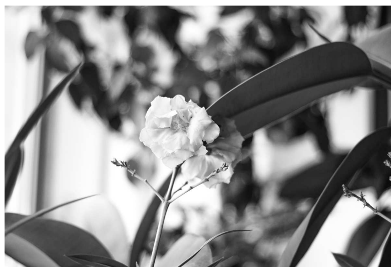
► Настоящая мини-оранжерея обустроена и в здании центральной столовой

Главный принцип правильного ухода за этими нежными растениями — умеренность в поливе, подкормке и освещении, ведь в природе орхидеи произрастают на стволах деревьев и отвесных скалах и попросту не нуждаются в чрезмерном поливе и обильном солнечном свете.