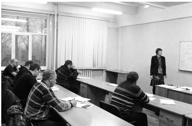
► Занятия в учебном классе завода

Как заблуждаются вчерашние студенты, думая, что полученных в годы учёбы знаний им с лихвой хватит на всю оставшуюся жизнь! В первый же рабочий день оказывается, что учиться необходимо постоянно, только «взрослая жизнь» вносит в процесс получения новых знаний свои коррективы — теперь для того, чтобы оставаться успешным и востребованным специалистом, нужно осваивать новые знания и умения максимально быстро и эффективно.