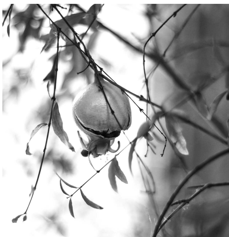
► Урожай гранатов в отделе Главного металлурга