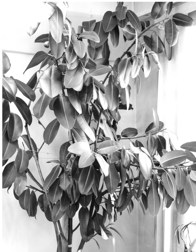
► Гордость коллектива Лаборатории неразрушающего контроля — могучий фикус, крона которого уже упирается в потолок

Фруктовые деревья, которые растут в одном из кабинетов отдела Главного металлурга, уже давно являются заводской достопримечательностью. Комнатные лимоны, с любовью выращенные металлургами, гораздо крупнее магазинных и отличаются насыщенным и терпким ароматом, а небольшие плоды другого экзотического питомца — граната, являются приятным дополнением к красивому и необычному деревцу.