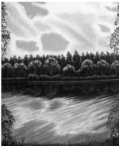
► Работы художника