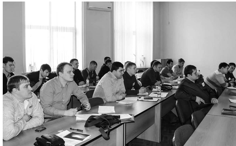
► На курсах повышения квалификации в городе Кемерово

— Вкладывая немало усилий в повышение квалификации и обучение персонала, мы, безусловно, ждём ответственного и инициативного отношения сотрудников к работе. Недостаточно, чтобы человек пришёл и отработал смену — важно, чтобы он знал, для чего это делает и к чему стремится. Поэтому работодатель ожидает от каждого своего сотрудника одного и того же набора деловых качеств — способности работать быстро, адаптироваться к новым условиям, мотивировать себя и других. На мой взгляд, это формирует абсолютно новую тенденцию, благодаря которой мы увидим качественно иной уровень рабочей силы. Наша задача — эту тенденцию поддержать.