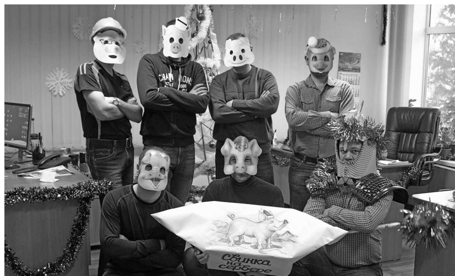
► Под масками символа наступающего года нетрудно узнать коллектив отдела информационных технологий