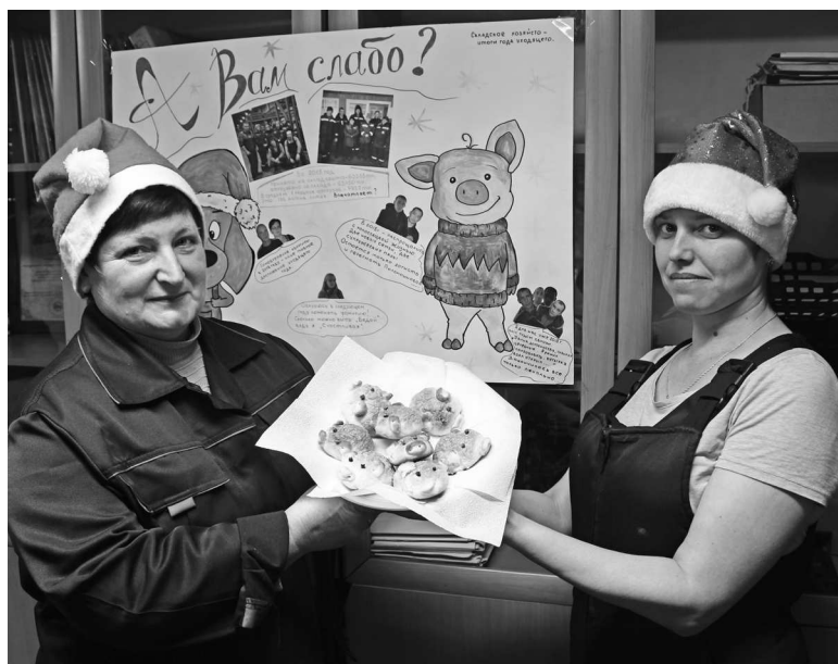
► Сотрудники Складского хозяйства угощают коллег аппетитными сдобными булочками в виде поросят