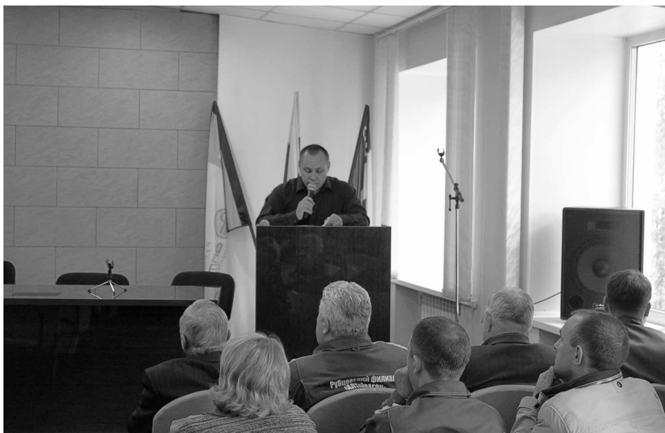
► Творческую мысль рационализаторов стимулируют и ежегодные научно-практические конференции, и соревнования по решению производственных кейсов

Как известно, непрерывное совершенствование производственных процессов — основа конкурентоспособности любого предприятия. Творческая мысль изобретателей и рационализаторов является истинно неиссякаемым внутренним резервом для генерации новых перспективных идей и решений. В Рубцовском филиале АО «Алтайвагон» знают, как найти и эффективно задействовать созидательный по-