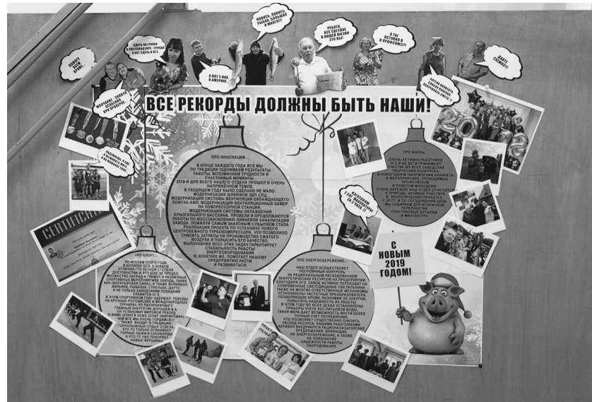
► Оригинальная стенгазета от сотрудников отдела Главного энергетика