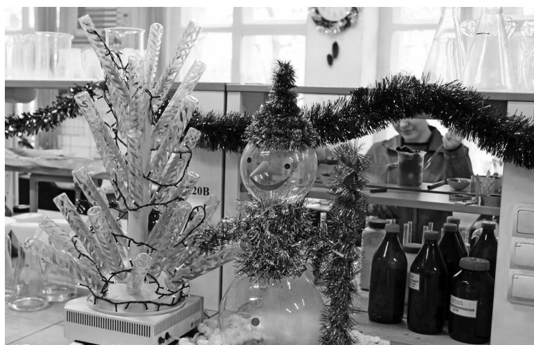
► В центральной заводской лаборатории гостей встречают снеговик и ёлочка из лабораторной посуды

В декабре в Рубцовском филиале «Алтайвагона» прошёл традиционный и горячо любимый заводчанами конкурс на лучшее новогоднее украшение кабинетов. В этом году организаторы конкурса предложили дополнить праздничное оформление интерьера стенгазетой, посвящённой итогам деятельности коллектива цеха или отдела в 2018 году, а также своими руками изготовить ёлочную игрушку производственной тематики. Более 20 трудовых коллективов завода с душой и любовью создавали новогоднюю сказку на своих рабочих местах — для себя, своих коллег и жюри конкурса, которое на прошлой неделе уже побывало «в гостях» у конкурсантов и определило победителей. Ниже мы публикуем самые яркие и необычные творческие находки участников конкурса!