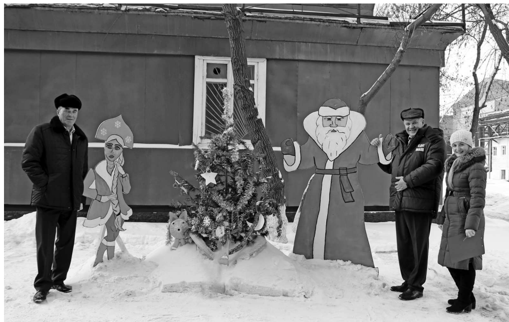
► Конкурсная комиссия с удовольствием сфотографировалась в новогодней фотозоне, созданной сотрудниками Литейного цеха №1