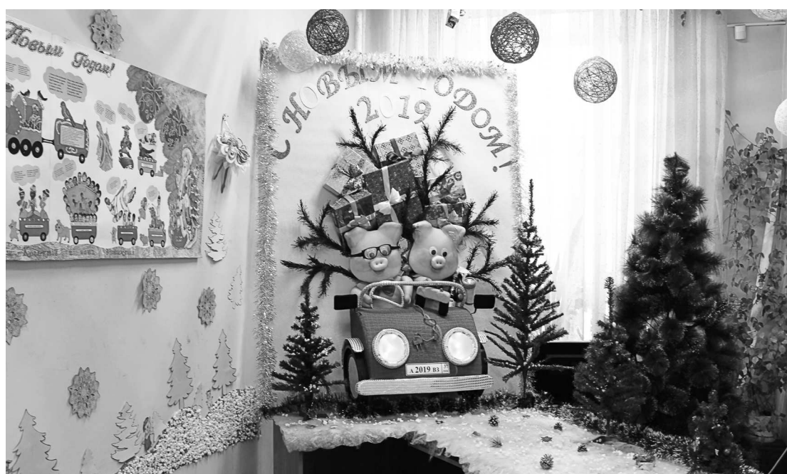
► По лаборатории неразрушающего контроля мчатся во весь опор поросята-дефектоскописты