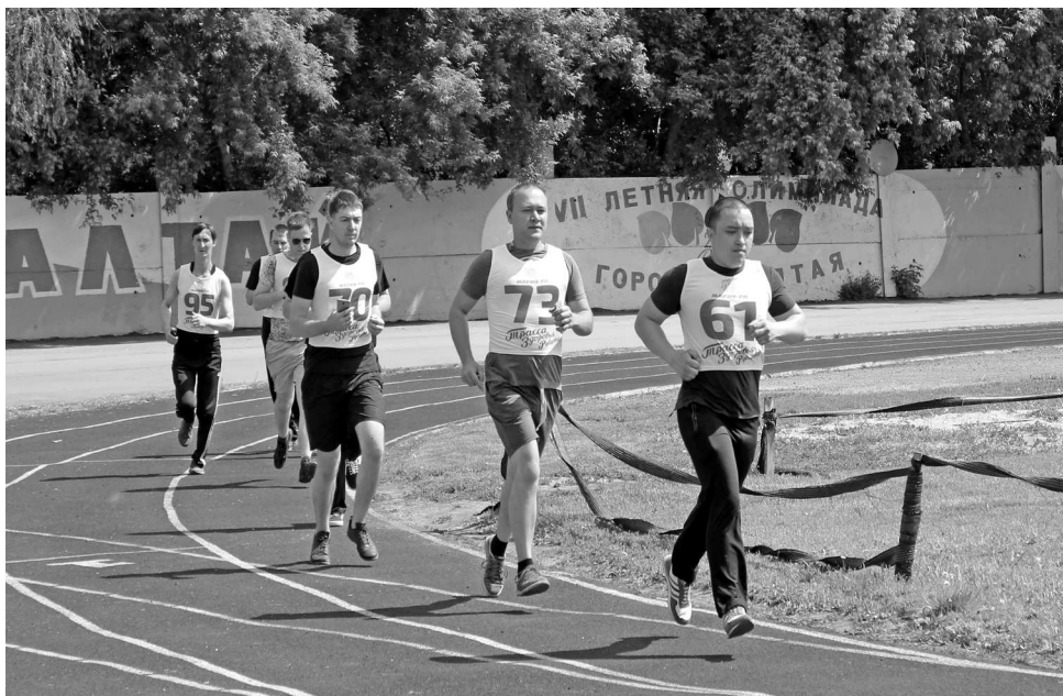
► Сотрудники Рубцовского филиала «Алтайвагона» выбирают здоровый образ жизни

Информацией о последствиях курения и полезных советах, помогающих заядлым курильщикам навсегда расстаться с этой вредной привычкой, пестрят все современные СМИ — газеты, журналы, телевидение, интернет. Однако в последние годы акцент в публикациях о вреде курения несколько сместился.