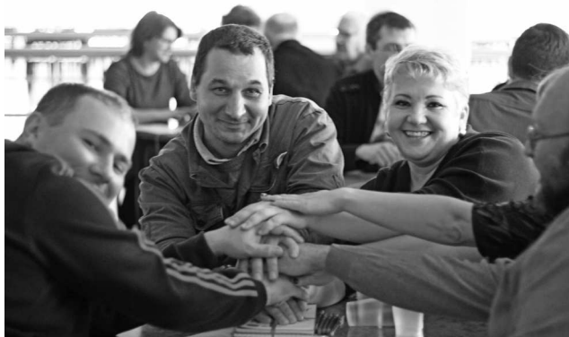
► Дружная и эмоциональная команда «Атасс» — настоящие ценители интеллектуальных игр

На минувшей неделе в Рубцовском филиале АО «Алтайвагон» состоялась очередная интеллектуальная игра «60 секунд». На этот раз свою смекалку, скорость реакции и навыки командной работы проверили не только сотрудники предприятия, но и ветераны.