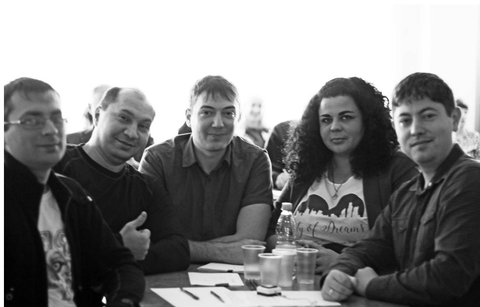
► В упорной интеллектуальной борьбе победу одержала команда «Галактика в опасности» (сборная заводоуправления)

На протяжении всех трёх раундов то одна, то другая команда перехватывала инициативу и набирала очки за правильные ответы, но победу с большим отрывом от остальных завоевала команда «Галактика в опасности». Второе место — у команды «Атасс», третье — у сборной команды «3+2».