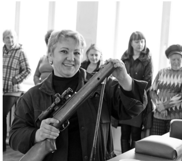
► Заводчанки стреляют метко. И не только глазками!