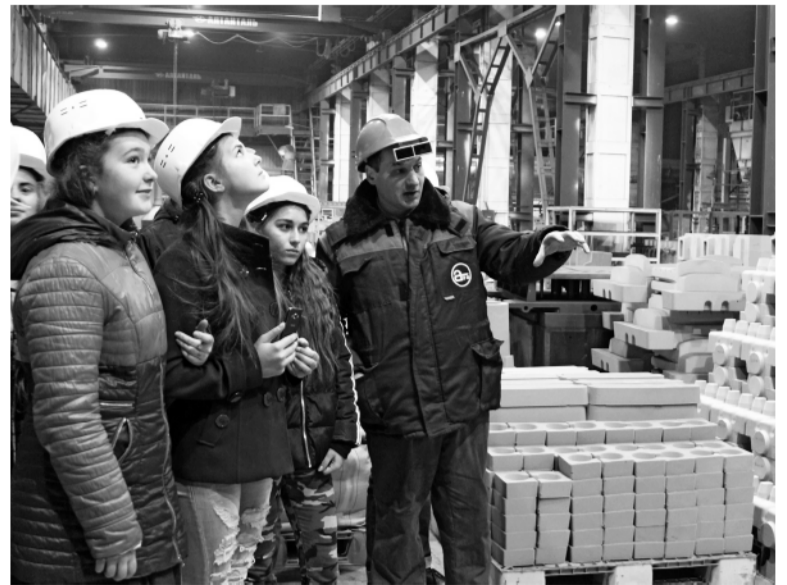
► Школьники на экскурсии в Сталелитейном цехе

В октябре Рубцовский филиал АО «Алтайвагон» принял участие во всероссийской акции «Неделя без турникетов». Данная акция вот уже второй год подряд проводится в разных регионах России и представляет собой комплекс мероприятий, направленных на информирование школьников о деятельности ведущих отечественных предприятий и популяризации инженерных специальностей и рабочих профессий. Ключевым мероприятием акции является проведение экскурсий на промышленных производствах для учащихся образовательных учреждений, абитуриентов и студентов технических ВУЗов.