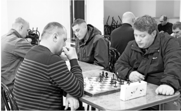
► «Умная» игра — шахматы, очень популярна среди сотрудников завода

Осенний этап Спартакиады Рубцовского филиала АО «Алтайвагон», в котором традиционно принимали участие и сотрудники предприятия, и ветераны, запомнился спортсменам и болельщикам яркими эмоциями, накалом честной борьбы и головокружительными победами. От всей души поздравляем победителей очередного этапа Спартакиады и публикуем небольшой фоторепортаж!