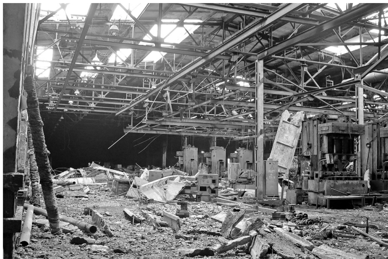
► Так выглядел один из производственных цехов завода в 2004 году

Вопрос о роли личности в истории, конечно, дискуссионный, но в истории становления и развития Рубцовского филиала АО «Алтайвагон» решающую роль сыграл именно человеческий фактор — героизм и стойкость специалистов, которые восстанавливали завод в тяжелейших условиях. В сентябре 2002 года, когда Холдинговая компания «Сибирский Деловой Союз» взяла в управление активы обанкротившегося Рубцовского завода тракторных запасных частей, его цеха были отключены от электроэнергии, тепла и водоснабжения. Завод был разрушен и разграблен практически до основания — от бывшего величия сталелитейного предприятия остались только голые стены. В создание нового производства тогда было вложено 700 миллионов рублей, а бытовые вопросы решались параллельно с восстановлением и запуском сталеплавильных печей.