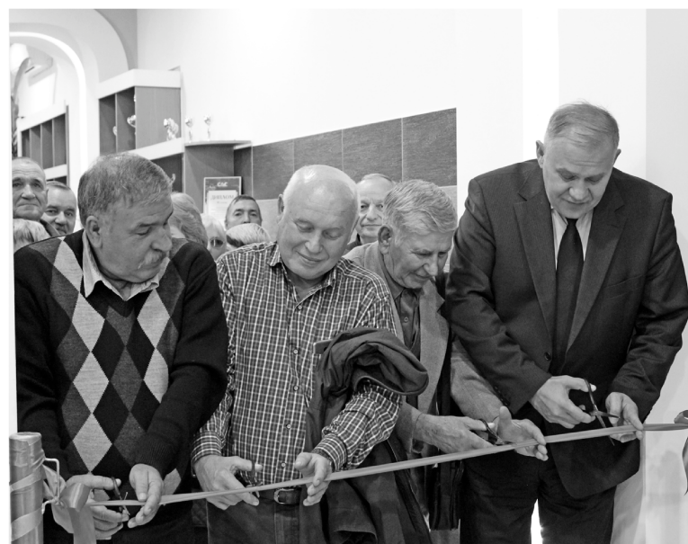
► Церемония открытия музея Рубцовского филиала АО «Алтайвагон»

восстановить завод. Все эти 15 лет перед Рубцовским филиалом «Алтайвагона» стояли масштабные задачи, но с каждой из них завод справился благодаря надёжному и проверенному коллективу заводчан. С таким коллективом любая задача предприятию по плечу!