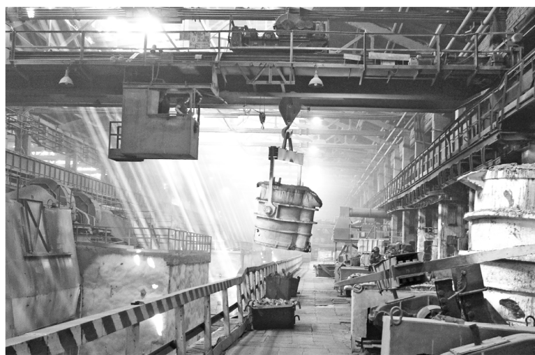
► Сталелитейный цех Рубцовского филиала АО «Алтайвагон» сегодня

— Многое из того, что было достигнуто, немислимо без сплоченного и целеустремленного коллектива, — отмечает ветеран завода и первый пред-