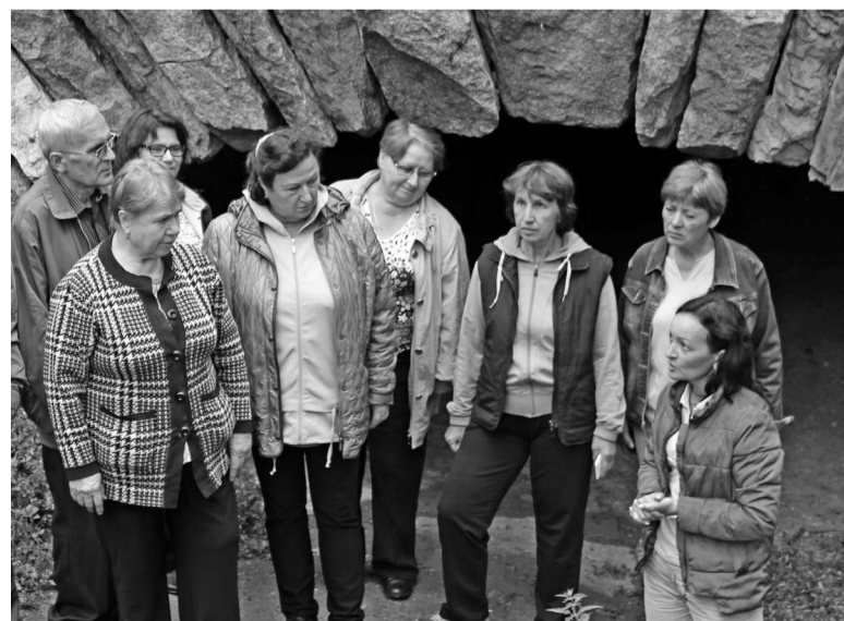
► У входа в штольню, сохранившуюся со времён XVIII века