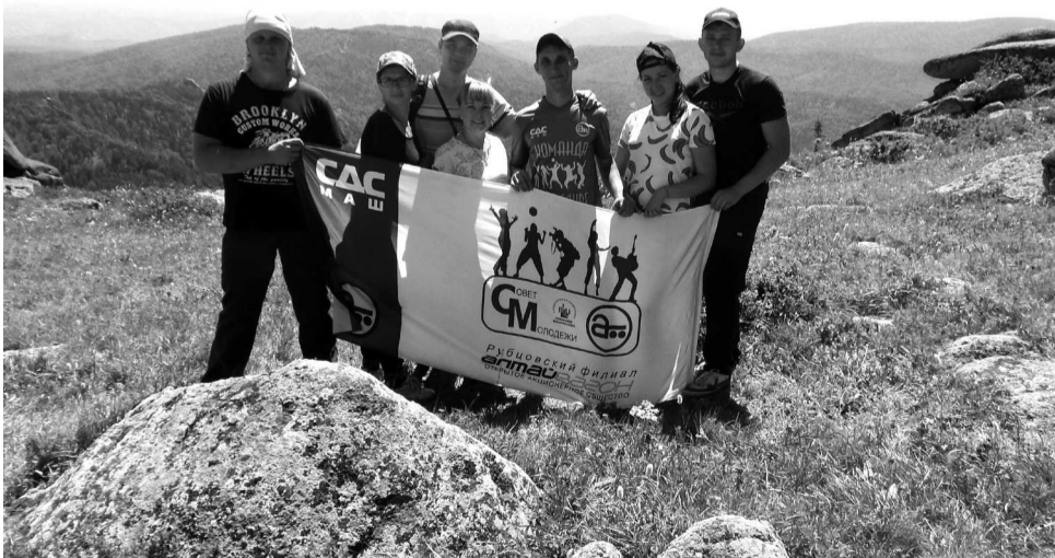
► Активисты Молодёжного Совета на вершине горы Синюха

Каждый год тысячи путешественников, вдохновлённые потрясающими видами горного Алтая, отправляются давно разведанными и новыми маршрутами, чтобы полюбоваться уникальными горными пейзажами, сравнимыми по красоте разве что с европейскими Альпами. Однако есть на Алтае места с такими прекрасными и вдохновляющими ландшафтами — на северо-западе