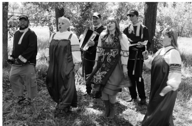
► Заводчане исполняют частушки на профсоюзную тематику

Летний сезон богат на спортивные события, так что возможностей помериться силами с представителями других организаций и предприятий у сотрудников Рубцовского филиала АО «Алтайвагон» будет предостаточно. С июля по сентябрь будет проходить Спартакиада трудовых коллективов города, продолжатся футбольные матчи летнего Чемпионата Алтайского края по мини-футболу — там наши спортсмены и продемонстрируют своё мастерство. О лучших спортсменах и новых победах спортивного актива завода читайте в августовском номере газеты «Алтайский металлург».