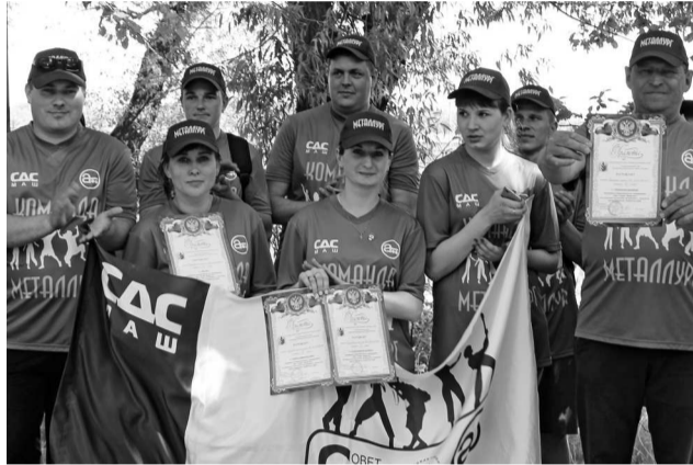
► Команда «Металлург» на церемонии награждения

Первым и самым зрелищным испытанием стала спортивная эстафета, стартовавшая одновременно для всех участников, затем команды разошлись по станциям. На станции «Творческая» участники представляли команду и исполняли частушки на профсоюзную тематику, на станции «Интеллектуальная» — решали задачки на эрудицию и логику, на станции «Туристическая» — отработывали навыки правильного