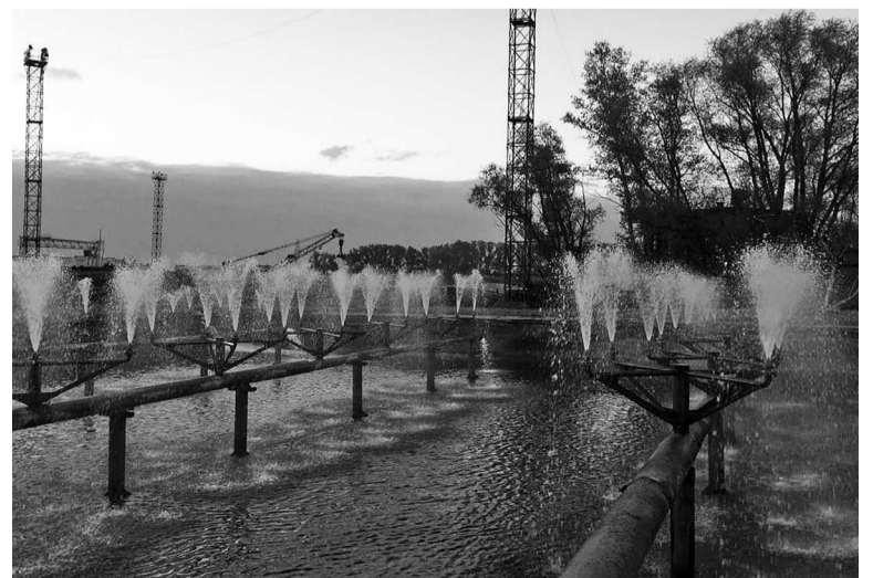
► Брызгальный бассейн Рубцовского филиала АО «Алтайвагон»

нию температуры воды брызгального бассейна оборотного водоснабжения, поступающего из закалочных баков термических печей Литейного цеха №1 в летний период. Кроме этого, решена задача по снижению степени загрязнения форсунок отходами производства (шлак, окалина, песок).