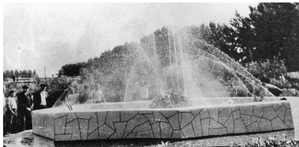
► Фонтан возле заводоуправления был построен в 1966 году по проекту начальника конструкторского бюро отдела главного механика В.Л. Боярова

— заводской посёлок в северной части города из 20 жилых домов общей площадью более 70 тысяч м 2 , заводская столовая на 400 посадочных мест. В 1967 году был построен пионерский лагерь «Гайдар» (в настоящее время детский оздоровительный лагерь «Золотая рыбка» — Прим. ред.) на берегу озера Горькое, в 1972 году открылся дом рыбака на реке Чарыш, в 1973 году — спортивный комплекс