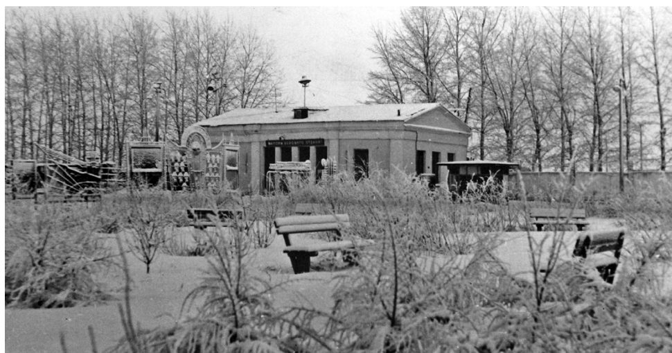
► Так выглядела проходная Рубцовского завода тракторных запасных частей в 1967 году

В сентябре 2018 года Рубцовский филиал АО «Алтайвагон» отметит 15-летие со дня первой выплавки стали. Условия, в которых была произведена первая плавка, лёгкими не назовёшь — в ходе восстановительных работ производственные цеха зачастую приходилось отстраивать заново. Тем не менее, Рубцовский филиал АО «Алтайвагон» за короткий срок смог не только встать на ноги, но и начать выпуск продукции. 56 лет назад, в 1962 году, на том месте, где впервые полилась сталь Рубцовского филиала АО «Алтайвагон», произошло не менее значимое событие — Рубцовский завод тракторных запасных частей произвёл первую выплавку стали.