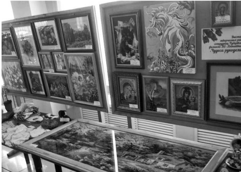
► Полюбоваться работами мастериц мог любой желающий

На заводе подведены итоги творческого конкурса для сотрудниц «Чудеса рукоделия», посвящённого Международному женскому дню. Организатором конкурса выступил Молодежный Совет предприятия.