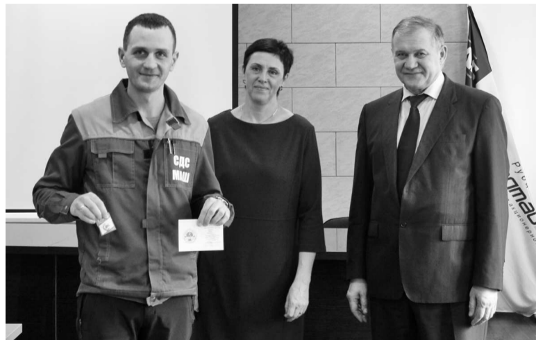
► На церемонии вручения знаков отличия ГТО

На этой неделе 26 сотрудников Рубцовского филиала АО «Алтайвагон» стали обладателями долгожданных знаков отличия Всероссийского физкультурно-спортивного комплекса «Готов к труду и обороне» (ГТО). Среди них — первые руководители предприятия, активисты Молодёжного Совета и представители старшего поколения заводчан.