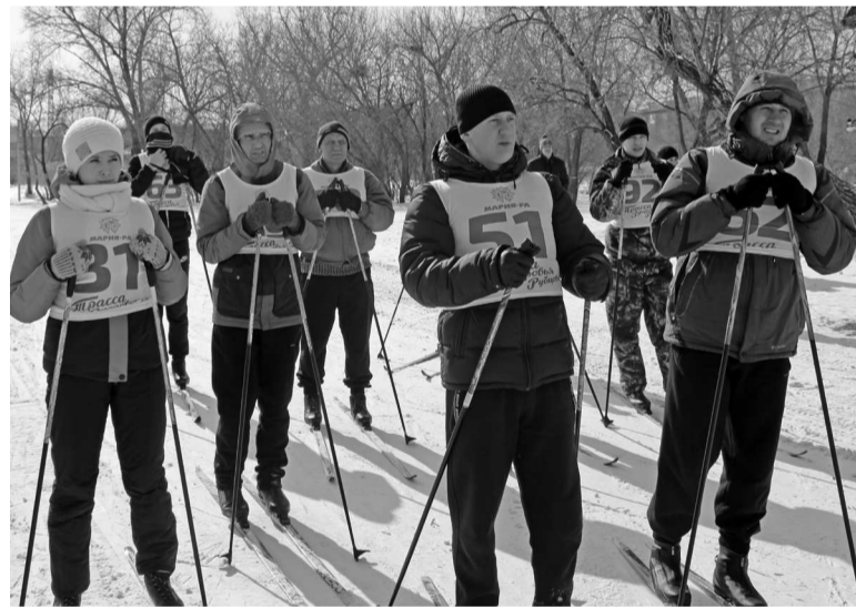
► Сотрудники Рубцовского филиала АО «Алтайвагон» на сдаче норматива ГТО по бегу на лыжах

Подать заявку на участие в выполнении норм комплекса ГТО можно, обратившись к руководителю своего отдела или цеха. Также необходимо стать полноценным участником программы, зарегистрировавшись на сайте ВФСК ГТО ( http://www.gto.ru ). Полученный по итогам регистрации идентификационный номер позволяет стать официальным участником сдачи норм ГТО, а также просматривать результаты пройденных испытаний.