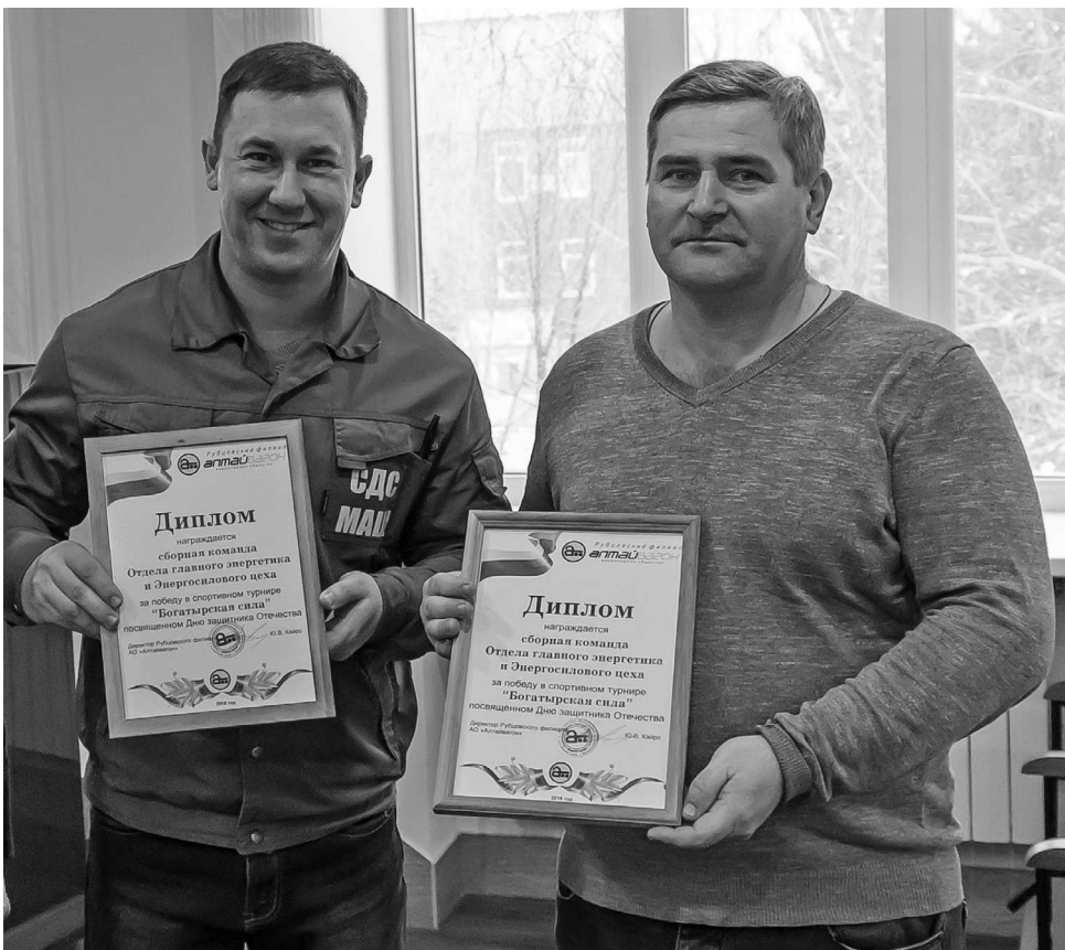
► Заслуженные награды победителям — сборной команде Отдела главного энергетика и Паросилового участка Энергосилового цеха

Турнир «Богатырская сила», как и любые командные состязания, был зрелищным, интересным и захватывающим. Нешуточный накал страстей, воля к победе и уровень физической подготовки участников свидетельствовали — не перевелись еще богатыри в Рубцовском филиале АО «Алтайвагон»!